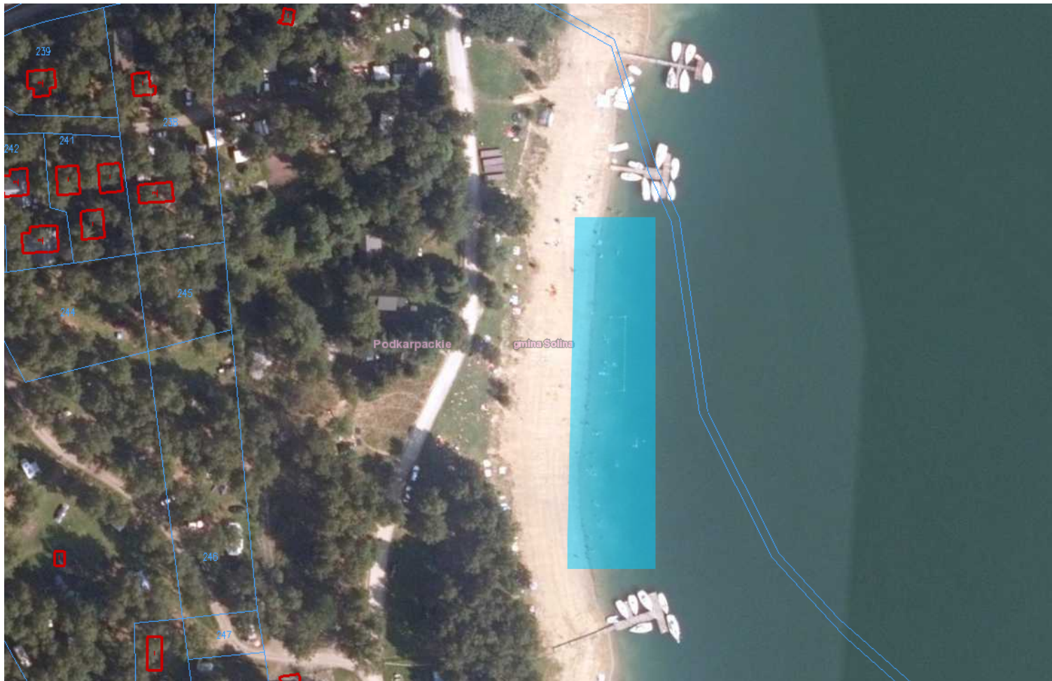
Kąpielisko - Patelnia w Polańczyku

Załącznik Nr 3 do uchwały Nr VII/101/19 Rady Gminy Solina z dnia 25 marca 2019 r.