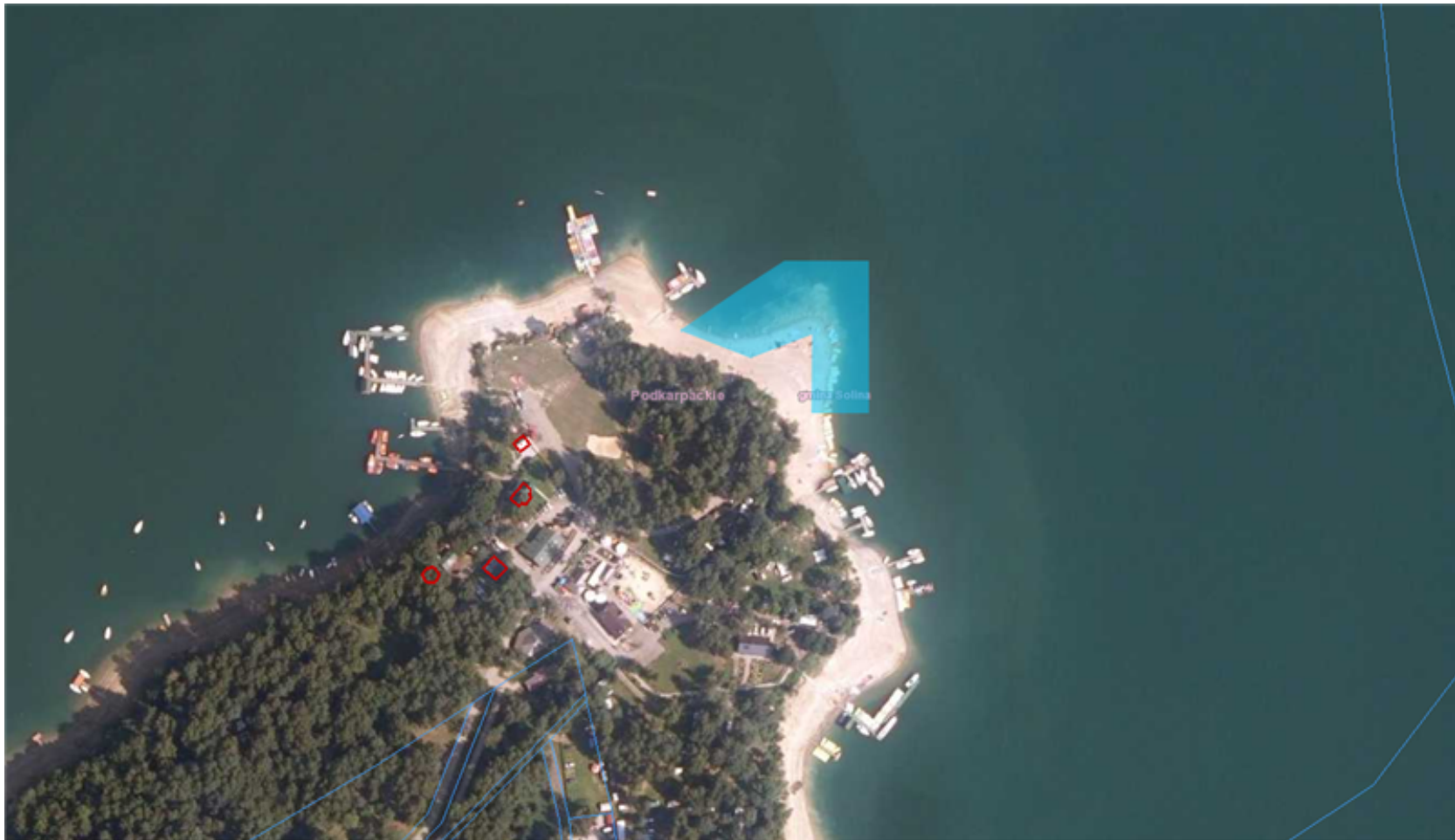
Kąpielisko - Cypel w Polańczyku

Załącznik Nr 1 do uchwały Nr VII/101/19 Rady Gminy Solina z dnia 25 marca 2019 r.